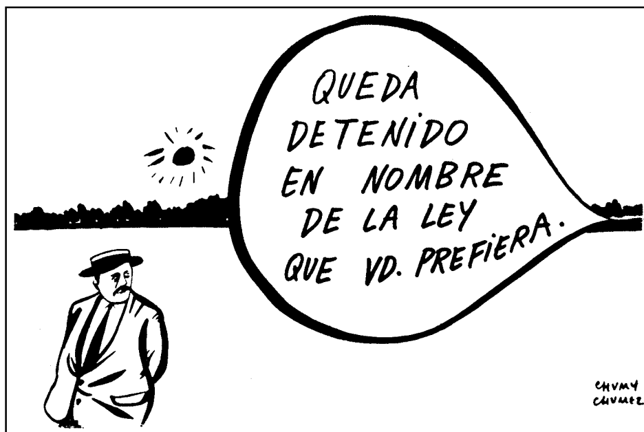
Chumi Chumetz. "Y así para siempre". Alianza Editorial. Madrid, 1972