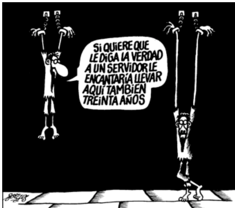
Forges. Lo mejor de Por Favor, Punch Ediciones

Sobre la extensión, métodos, estadísticas, tratados de prevención, etc., os remitimos, como decíamos, a los informes de A.I. mencionados anteriormente.